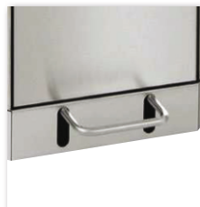
Trethebel aus Edelstahl